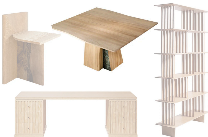
Chaise en frêne, noyer et chêne, Tokyo (Rinku); Table en orme brossé et placage de tamo, Etretat (Bruno Moynard Editions); Bureau en cèdre et chêne naturel, Kitayama (Garnier & Linker); Bibliothèque en chêne, design Rasmus Fenhann, Kumiko Shelf High (Galerie Maria Wettergren)

L' esprit japonais est de retour avec ses formes pures, matières lisses et style minimaliste. Épuré et léger, le bois couvre les murs et le sol pour harmoniser l'espace avec élégance. Accueillir la lumière à travers les lattes ou de grandes ouvertures en verre conjugue luxe et discrétion avec transparence et modernité.